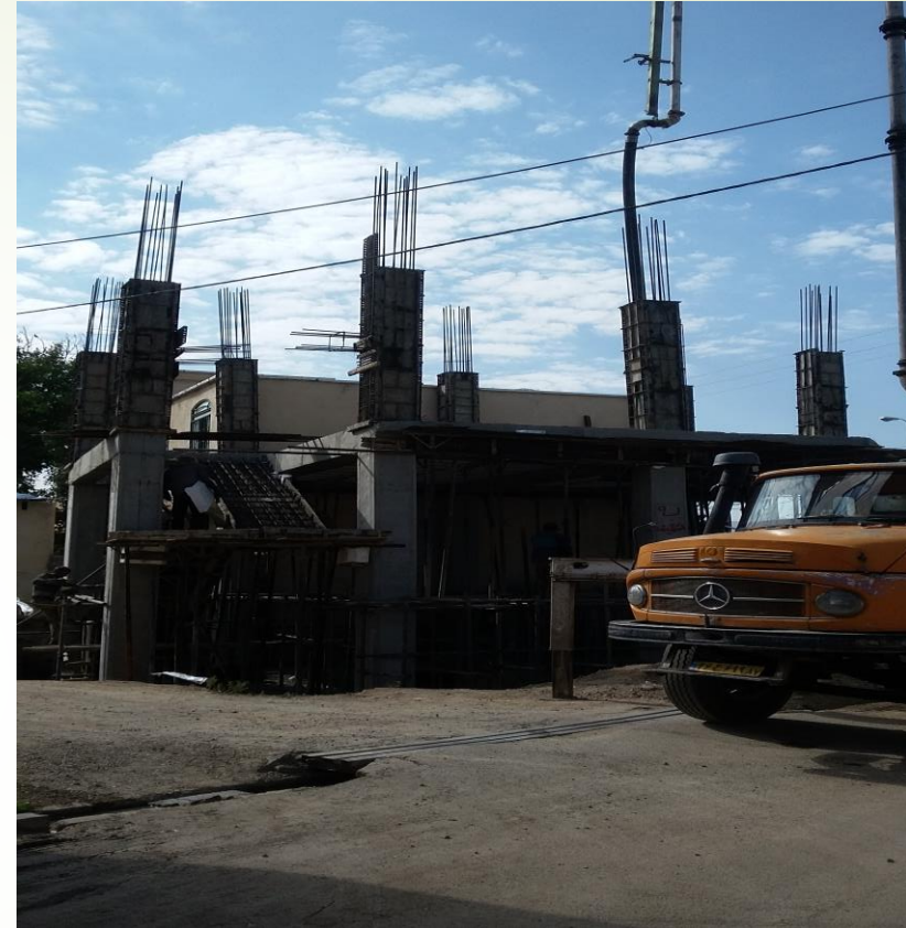
قالب بندی و بتن ریزی ستونهای طبقه اول شهریور ۱۳۹۷