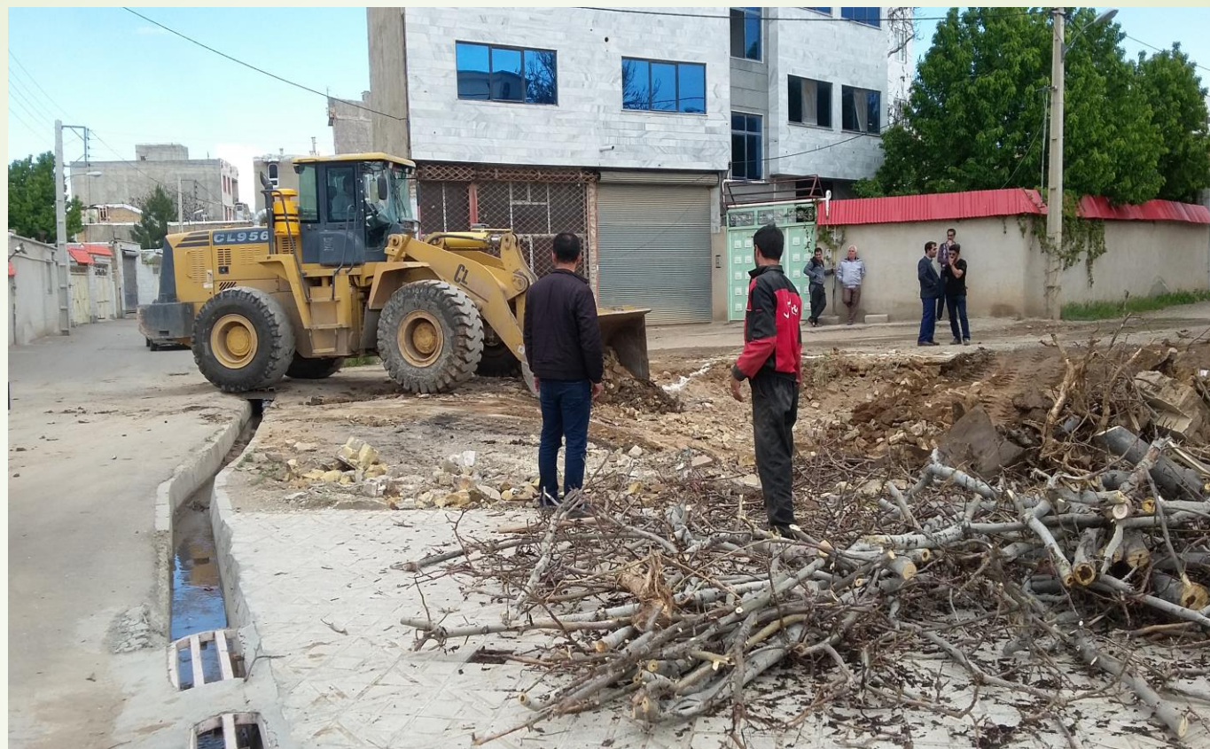
تسطیح و پاکسازی زمین دفتر نمایندگی خرم دره اردیبهشت ۱۳۹۷