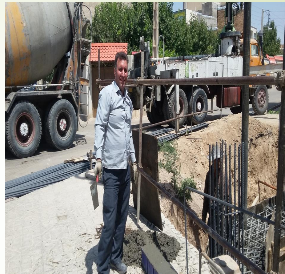
بتن ریزی فونداسیون ساختمان دفتر نمایندگی خرم دره