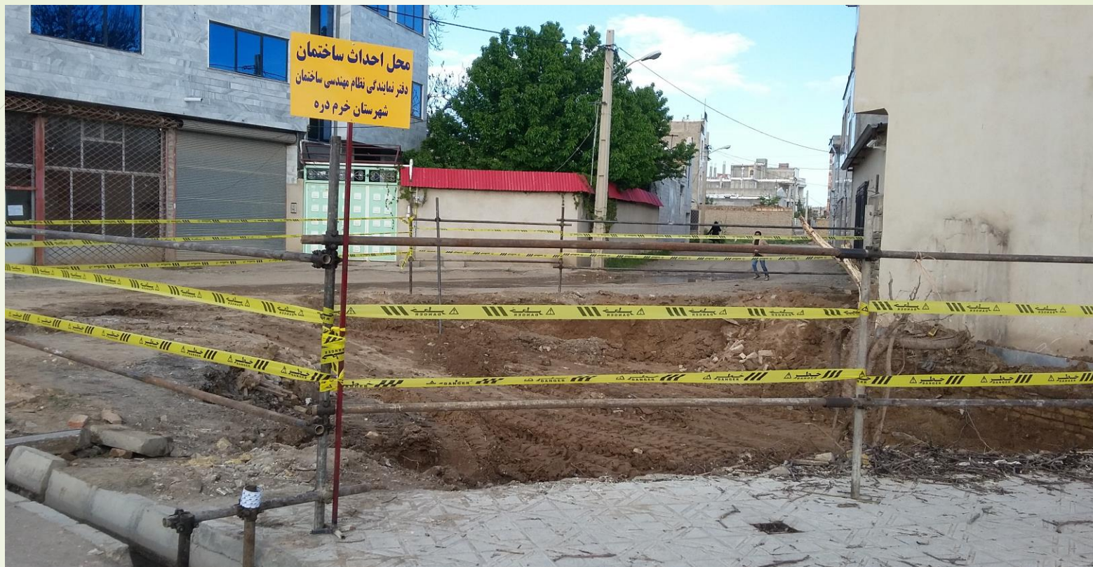
زمین دفتر نمایندگی خرم دره