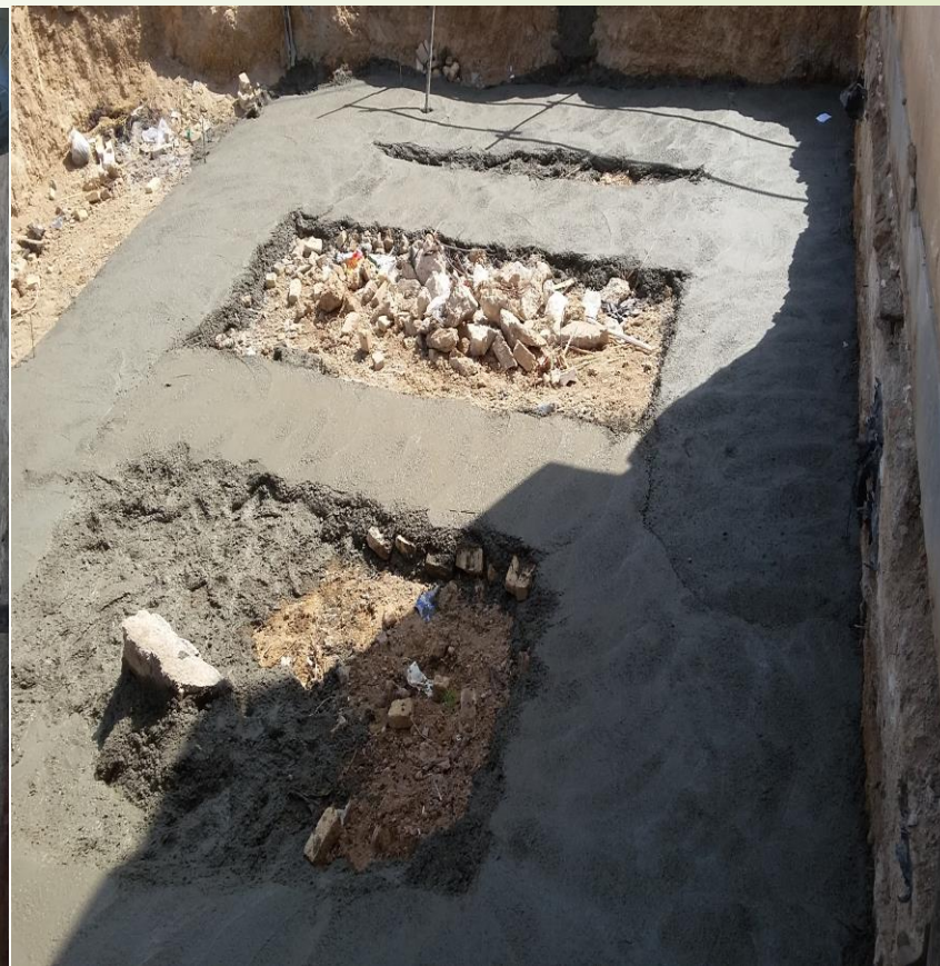
اجرای بتن مگر ساختمان دفتر نمایندگی خرم دره