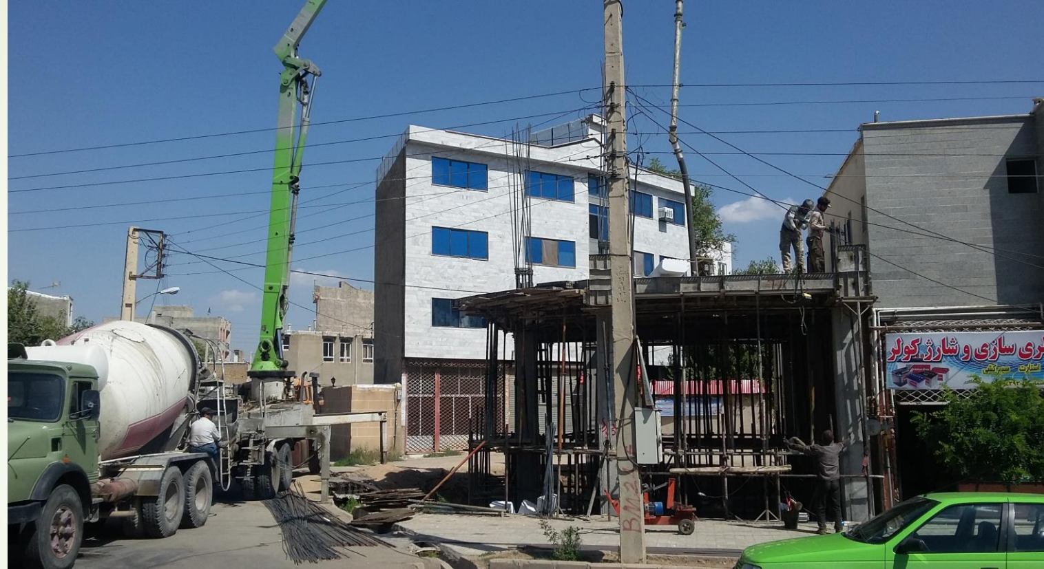
بتن ریزی سقف همکف ساختمان دفتر نمایندگی خرم دره